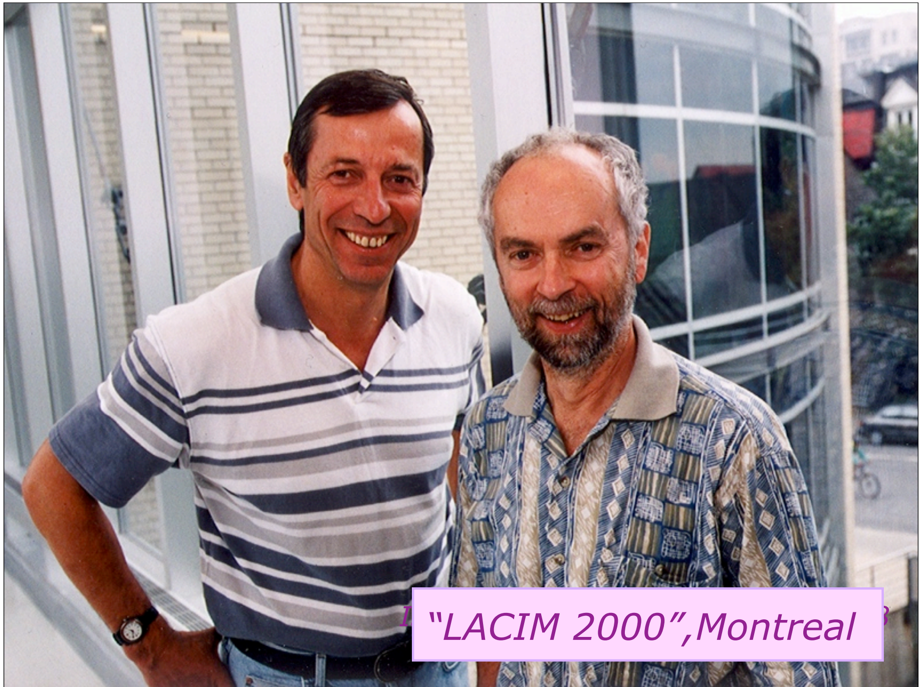
"LACIM 2000", Montreal