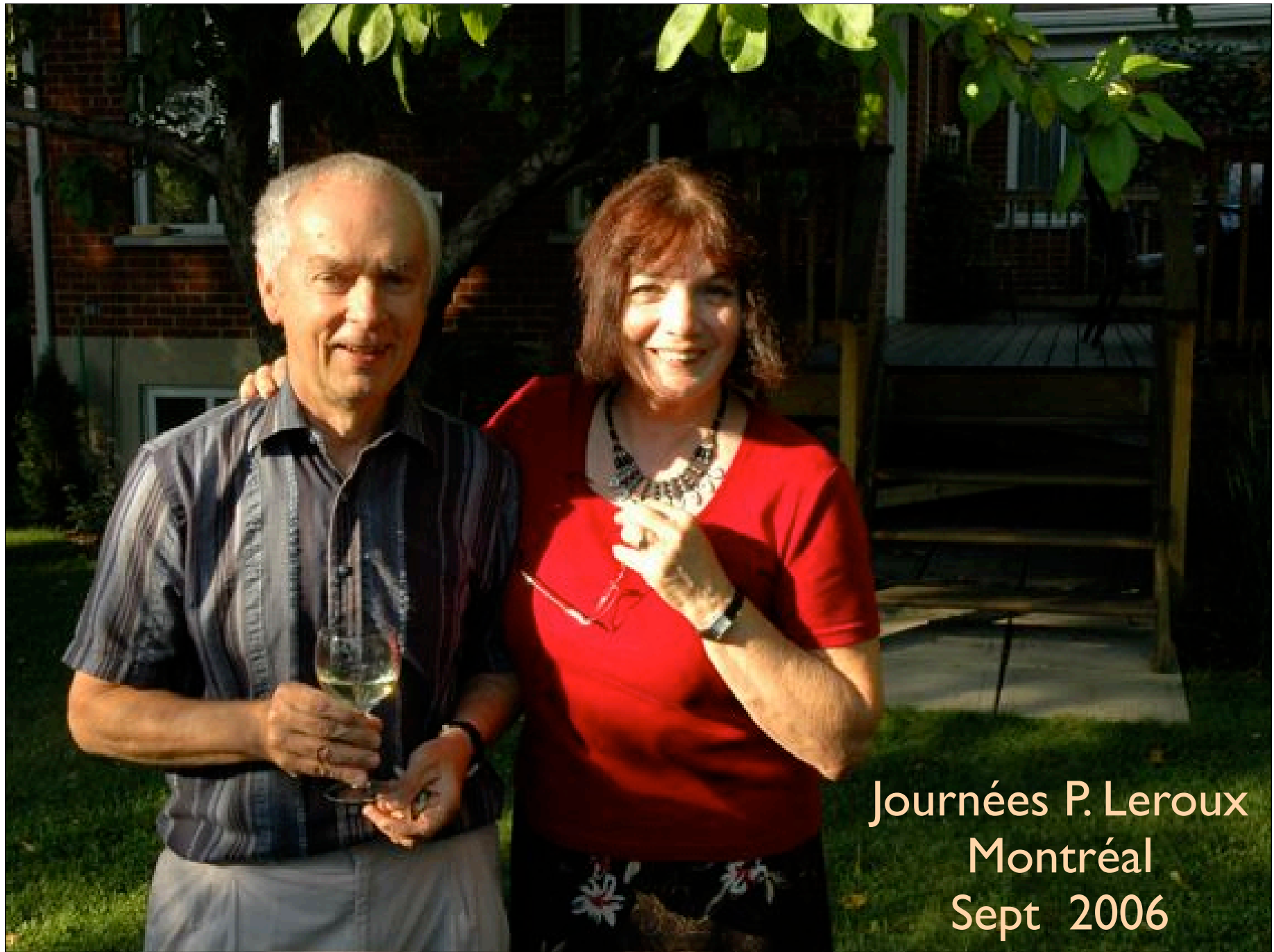
Journées P. Leroux Montréal Sept 2006