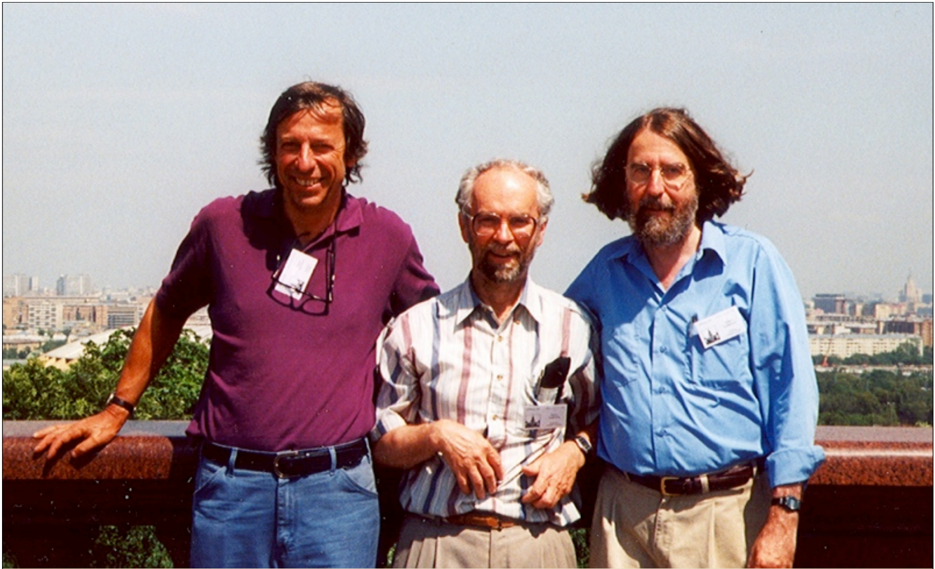
12th FPSAC (Formal Power Series and algebraic combinatorics) Moscow 2000